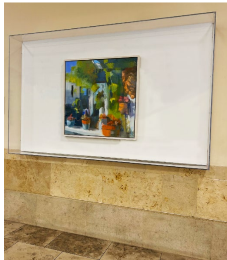
Terra Cotta Pots , 2022, instalado en el área de equipaje B ( Baggage Area B )

Para obtener más información sobre Kimberleigh y su trabajo, visite www.kimberleighwood.com o sígala en Instagram @hausofwood.