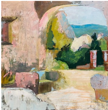
Mission Garden Bench SJC, 2023