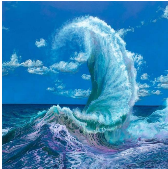
Hand of God , Jeffries Moore, Oil on Canvas, 2021

Những tranh vẽ đầy năng động và siêu thực tế của Jeffries Moore tìm cách thu tóm biển ở mức độ mạnh bạo nhất, nhấn mạnh đến cả hai cái đẹp và sự nguy hiểm của nước. Bức tranh ở độ lớn mang tên Hand of God chắc chắn là trụ điểm chú ý của cuộc triển lãm.