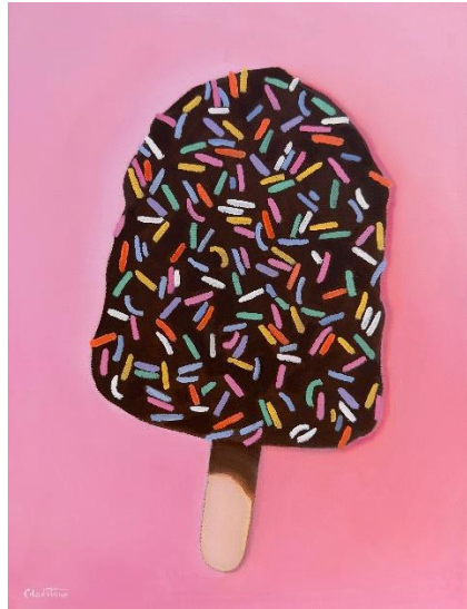
I'll Have Sprinkles (藝術微噴，2023年) ——瓊·格萊斯頓

杰弗里斯·摩爾充滿活力、超現實的畫作力求捕捉大海最強大的一面，突出水的美麗和危險。他的大型畫作《上帝之手 ( Hand of God ) 》無疑是本次展覽的焦點。