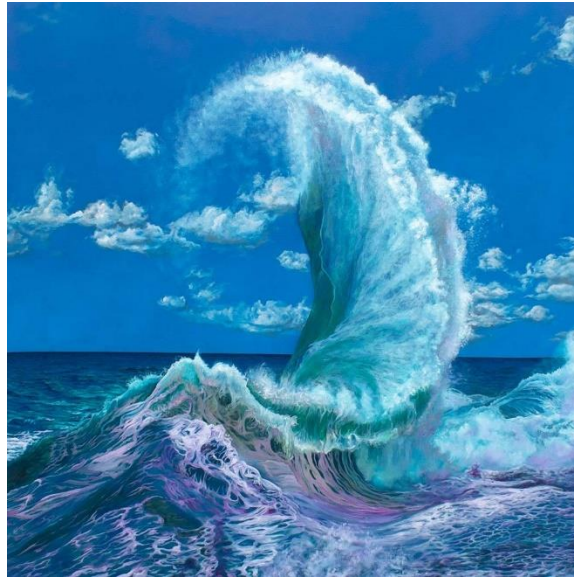
上帝之手 (布面油畫，2021年) ——杰弗里斯·摩爾

杰弗里斯·摩爾充滿活力、超現實的畫作力求捕捉大海最強大的一面，突出水的美麗和危險。他的大型畫作《上帝之手 ( Hand of God ) 》無疑是本次展覽的焦點。